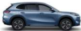
GLACIER BLUE (H30)