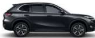
POLAR BLACK (H28)