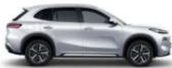
ALPINE WHITE (H32)