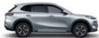
CLOUDVEIL SILVER (H33)