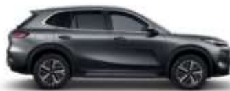
VOLCANIC GRAY (H29)