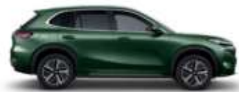
JUNGLE GREEN (H31)